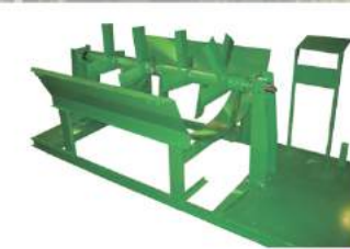
ШНЕК ИЗ НЕРЖАВЕЮЩЕЙ СТАЛИ ДЛЯ ПЛОТНОЙ СМЕСИ ВКЛЮЧАЮЩЕЙ МУЛЬЧУ