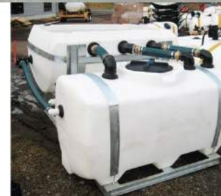
КОМБИНИРОВАННЫЙ ТИП ДЛЯ СОЧЕТАНИЯ МЕХАНИЧЕСКОГО И ГИДРАВЛИЧЕСКОГО СМЕШИВАНИЯ