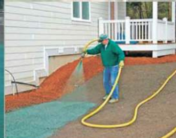
РАЗЛИЧНЫЙ ТИП СОПЛ ДЛЯ РАСШИРЕНИЯ ФУНКЦИОНАЛЬНОСТИ РАБОТ