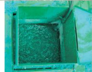
ГИДРАВЛИЧЕСКИЙ ТИП СМЕШИВАНИЯ ДЛЯ ЛЕГКИХ СМЕСЕЙ