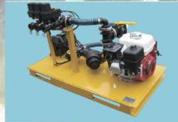
ДУНАПРАВЛЕННАЯ ПОМПА ДЛЯ БЫСТРОГО СМЕШИВАНИЯ СМЕСИ