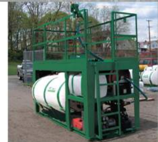
ДВА ДВИГАТЕЛЯ ДЛЯ ПОВЫШЕНИЯ ПРОИЗВОДИТЕЛЬНОСТИ И РАЗДЕЛЕНИЯ ПЕРЕДАВАЕМОЙ МОЩНОСТИ